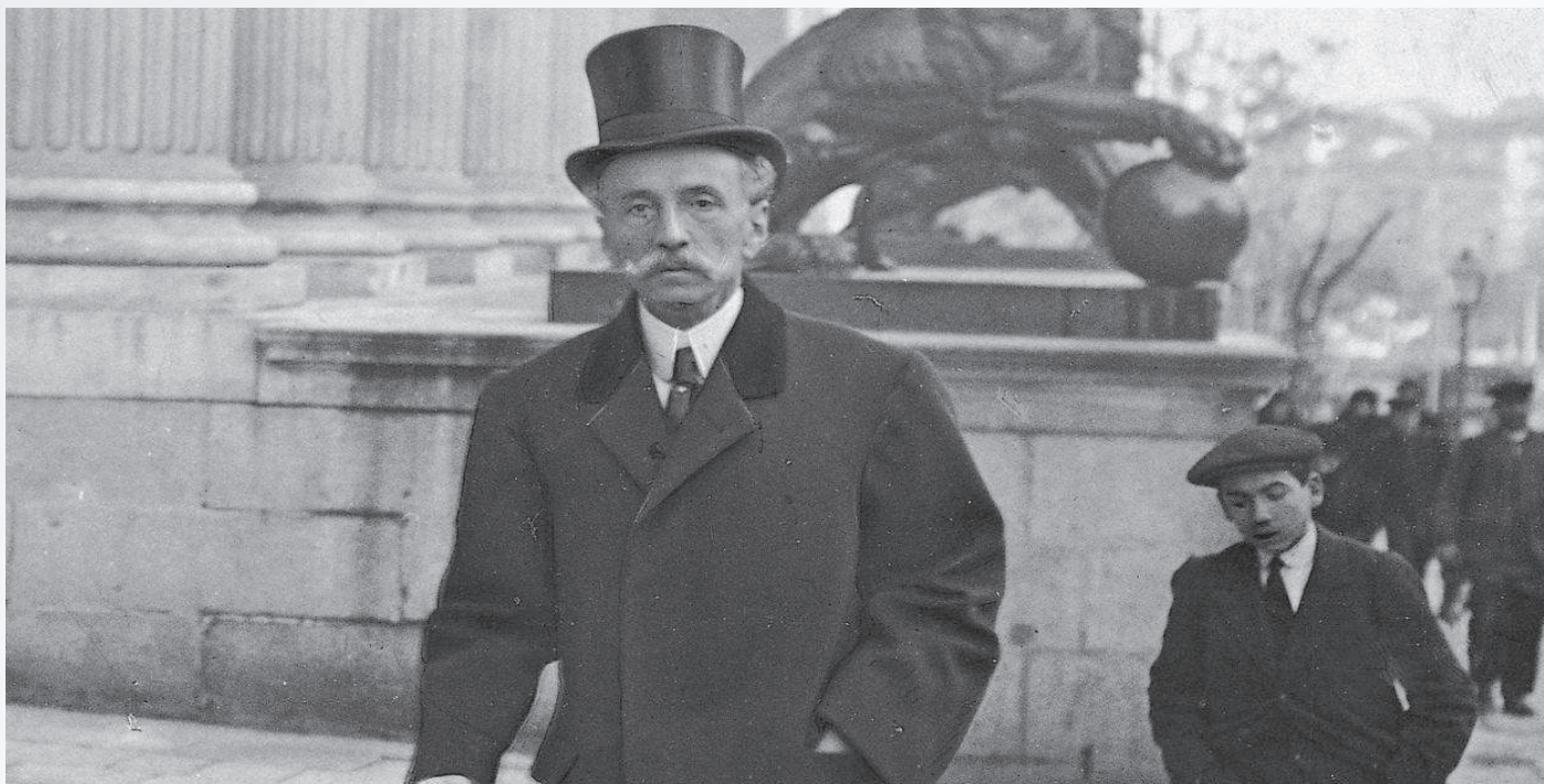
La primera Ley de accidentes de trabajo fue aprobada el 30 de enero de 1900 durante el gobierno de Eduardo Dato

Los orígenes de las actuales Mutuas se remontan a las instituciones de estructura mutualista que habían venido funcionando desde el siglo XII, fundamentalmente Hermandades de Socorro Mutuo, Montepíos y Cofradías.