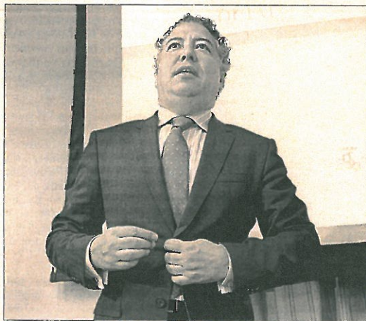
El secretario de Estado de la Seguridad Social, Tomás Burgos.

"Afortunadamente, no invertimos la 'hucha' de las pensiones en las cajas de ahorros"