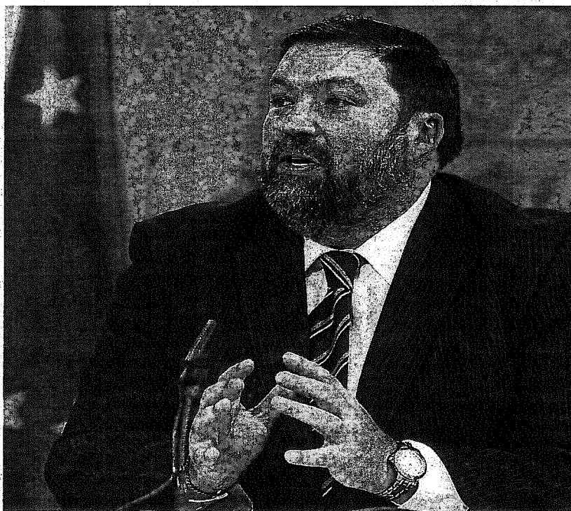
El titular de Justicia, Francisco Caamaño.

Otro capítulo que deja perplejos a los expertos tiene que ver con el tratamiento del acoso laboral o la lesión de derechos fundamentales del traba-